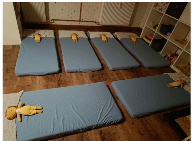
Hier schlafen wir